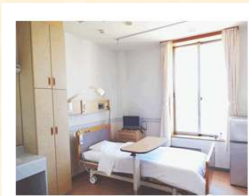
患者さんのお部屋の様子