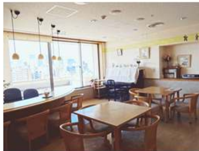
ダイニング、キッチンの様子