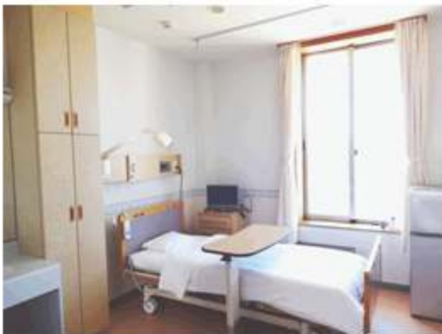
患者さんのお部屋の様子