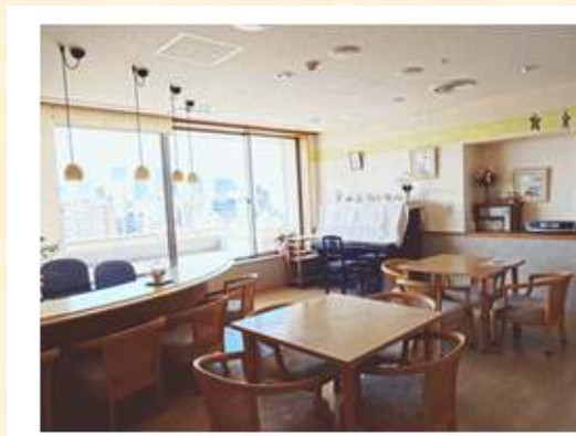
ダイニング、キッチンの様子