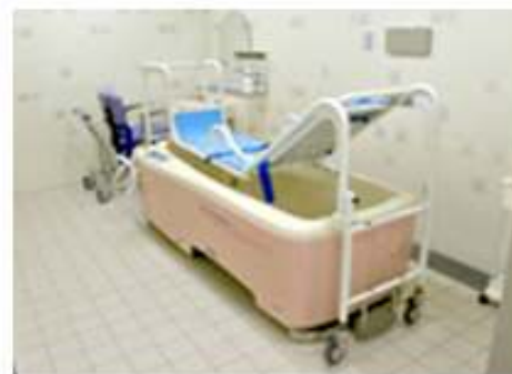
寝たまま入れるお風呂の様子